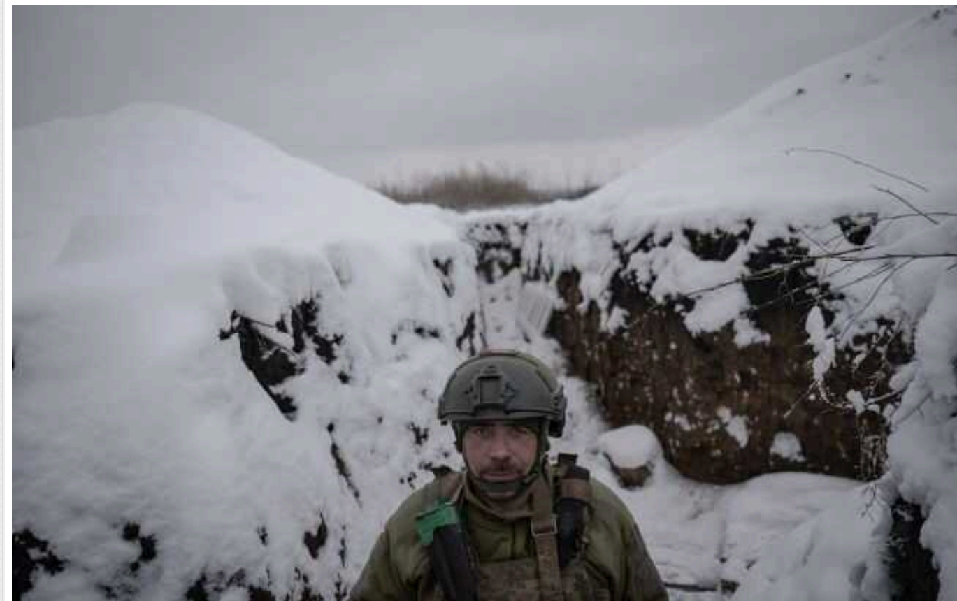
Україна і Росія ведуть технологічну гонку в війні: в ISW розповіли про ключові виклики

Збройні сили України та окупаційні війська РФ нині беруть участь у тактичній і технологічній гонці озброєнь для наступу та оборони. Під час неї обидві сторони експериментують й адаптують свої дальні удари та протиповітряну оборону.