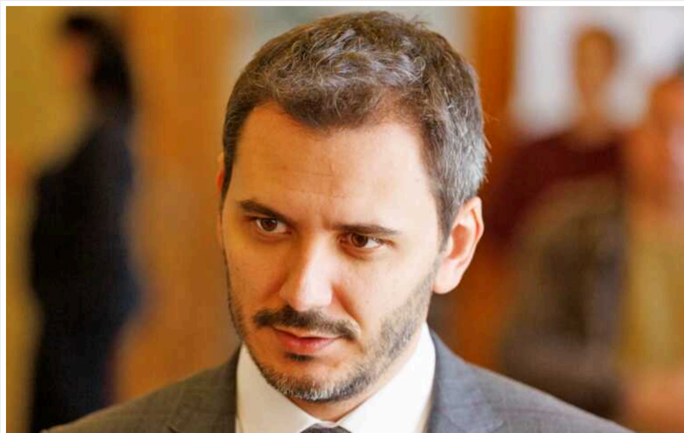
Законопроект щодо мобілізації: є три варіанти та спірні питання, - нардеп

У Раді зараз розглядають три варіанти щодо того, що далі робити з урядовим законопроектом про мобілізацію. У документі багато що потрібно змінити.