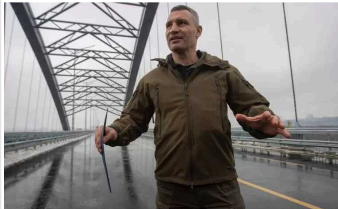
Чому відкритий Кличко проїзд Подільським мостом - це небезпечна показуха

На початку грудня 2023 року сталася подія, на яку чекали всі кияни, а особливо мешканці Троєщини – мер Києва Віталій Кличко особисто в режимі онлайн запустив рух Подільським мостовим переходом. Однак, чи справді виправдалися очікування мешканців? На жаль ні. Міський голова вкотре пустив пилочку в очі, при цьому наражаючи людей на небезпеку. Адже він відкрив проїзд цим інфраструктурним об'єктом без введення в експлуатацію, що суперечить закону і несе загрозу для киян.