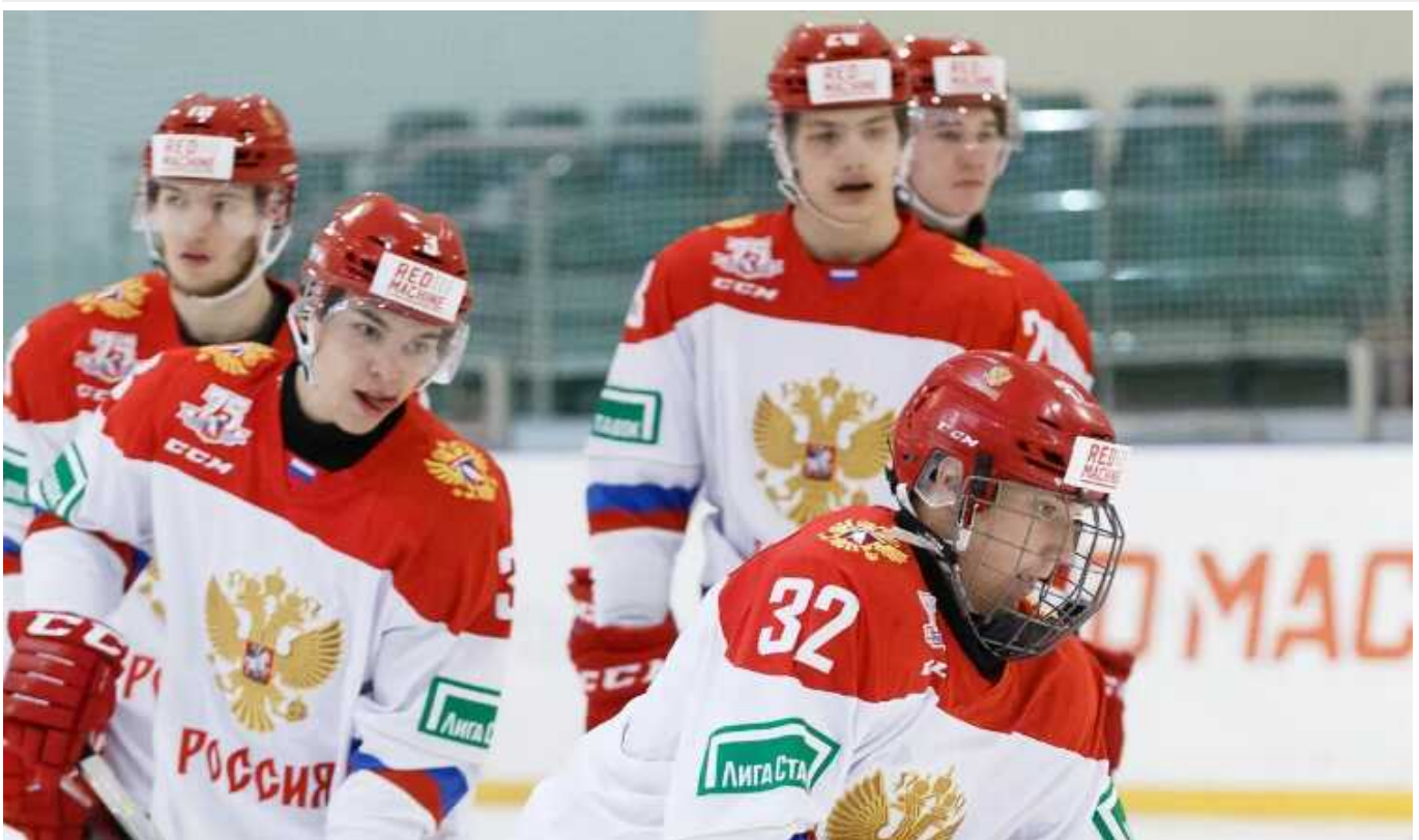
У РФ заявили, що в їхньої збірної "відібрали золоті медалі" чемпіонату світу, на якому вона навіть не грала

Президент Федерації хокею Росії Владислав Третьяк висловив абсурдну думку, що національну команду з РФ позбавили перемоги на молодіжному чемпіонаті світу, куди її навіть не допустили. Триразовий переможець Олімпіади поскаржився на те, що представникам країни-агресорці "не дали шансу виступити на такому високому рівні".