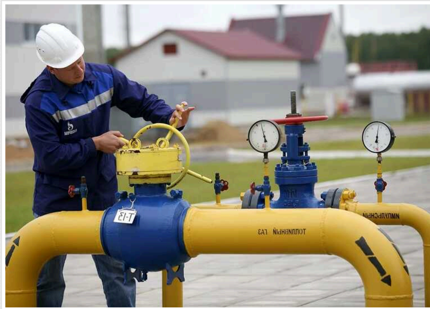
Bloomberg: Європа не замерзає без російського газу навіть у сильний холод

Незважаючи на морози до -25 градусів, європейські газові трейдери, по суті, вже пройшли цю зиму завдяки суттєвим запасам палива. Це показало, що тактика російського диктатора Володимира Путіна, збудована на погрозах "заморозити" Європу, повністю провалилася.