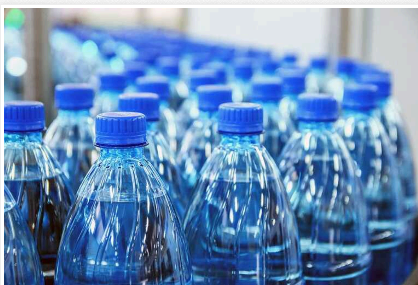
Міноборони провели тендер на постачання питної води на 110 мільйонів – ціну знизили до 3,9 грн/л

31 по 6 січня в системі «Прозорро» оприлюднено 30 тисяч повідомлень про закупівлі на 22,41 млрд грн.