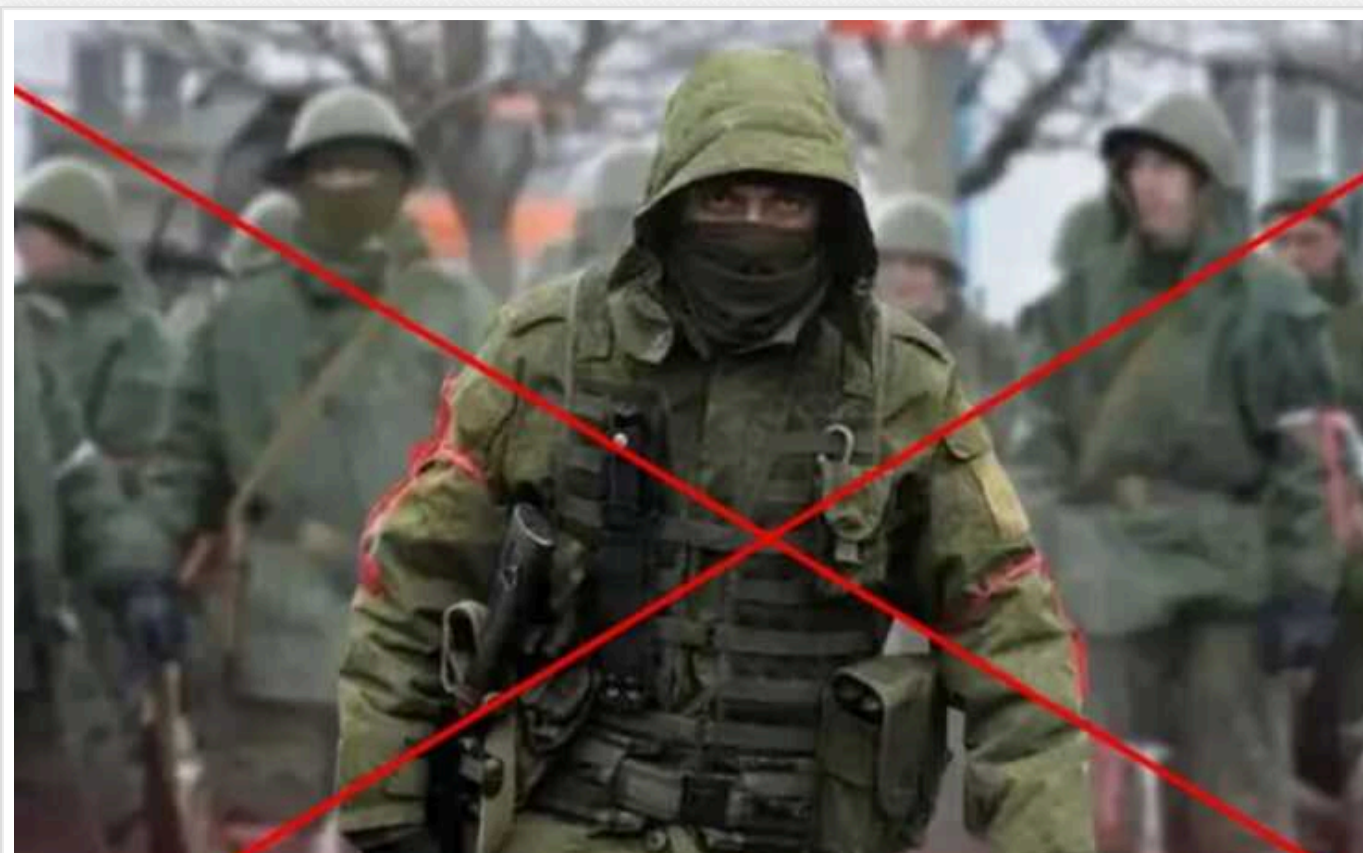
Російські контрактники поставили рекорд у "забігу" на той світ

Росіяни, які добровільно вступили до лав окупаційної армії РФ, сподівалися "непогано підзаробити", але в результаті отримали по заслугах і повернулися додому вже в трунах.