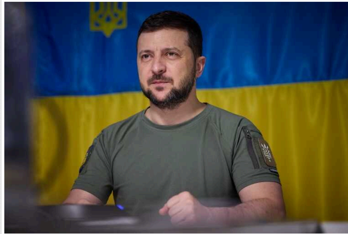
Зеленський пообіцяв, що січень буде насиченим для зовнішньої політики: "Зможемо посилити нашу державу"

Президент України Володимир Зеленський заявив, що січень буде насиченим із погляду зовнішньої політики нашої держави. Він анонсував багато кроків для посилення України, зокрема, йдеться про нашу ППО, а також співпрацю з партнерами щодо дронів.