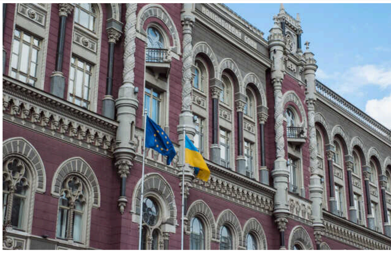
НБУ оштрафував 5 банків на 67 мільйонів гривень

Національний банк України (НБУ) у грудні оштрафував п'ять банків - Оксі Банк, Акордбанк, Універсал Банк (топо) та МТБ Банк - на загальну суму понад 66,74 млн грн, повідомив регулятор на сайті.