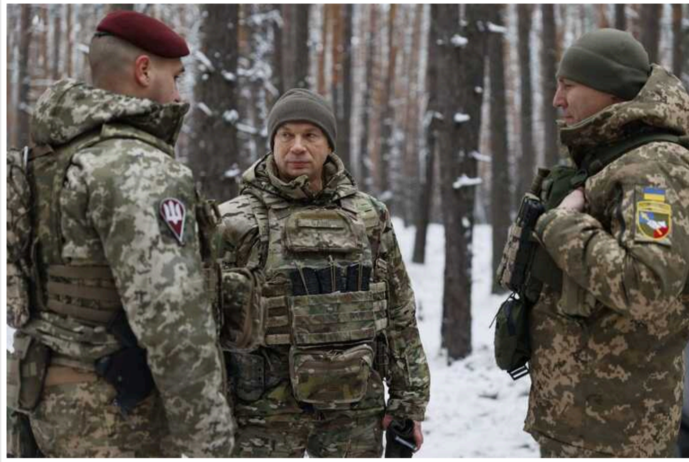
Силам оборони вдається завдавати ворогові відчутних втрат, - Сирський прокоментував ситуацію на Куп'янському напрямку

Читати на русском Додати як бажане джерело в Google