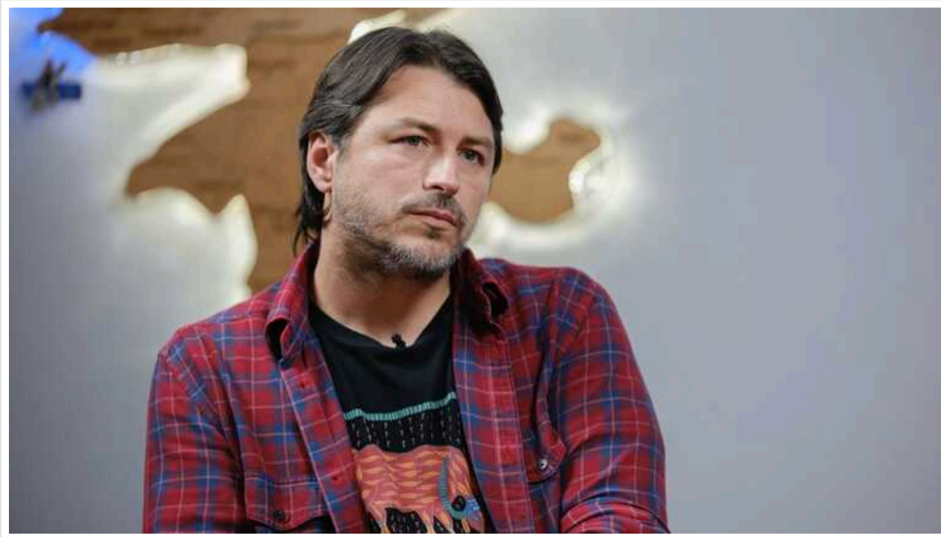
Притула висловився про недоліки мобілізації: "На це треба час"

Усе частіше українці обговорюють питання мобілізації. Не залишився осторонь цієї теми і Сергій Притула. Ведучий та волонтер зазначив, що поведінка деяких співробітників ТЦК його просто вражає.