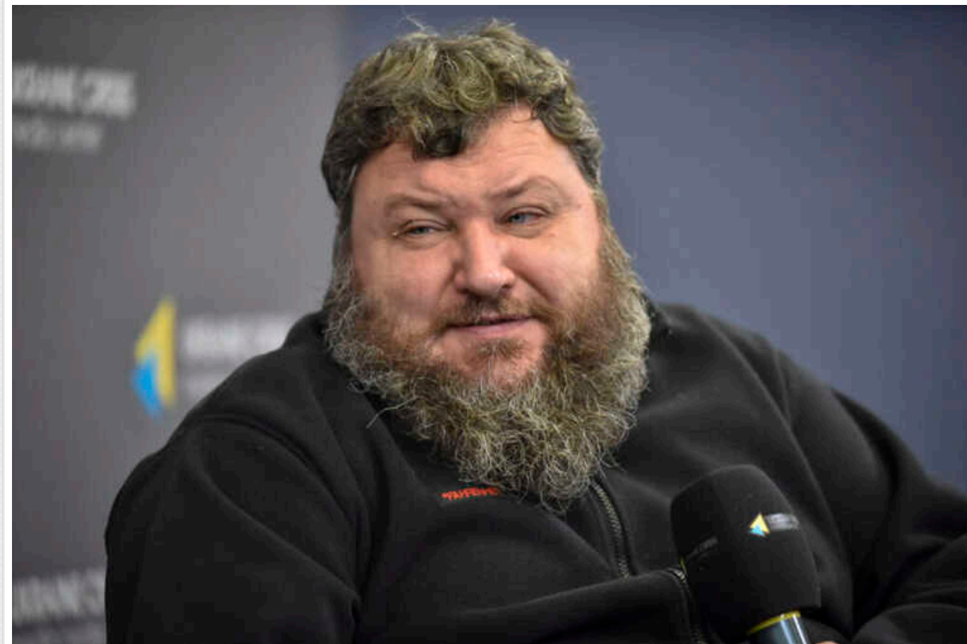
Це постріл собі в ногу, - військовий аналітик про екстрадицію ухиялєнтів з-за кордону

Ідея мобілізації чоловіків за кордоном – малореальна, до того ж, це в перспективі нашкодить самій Україні.