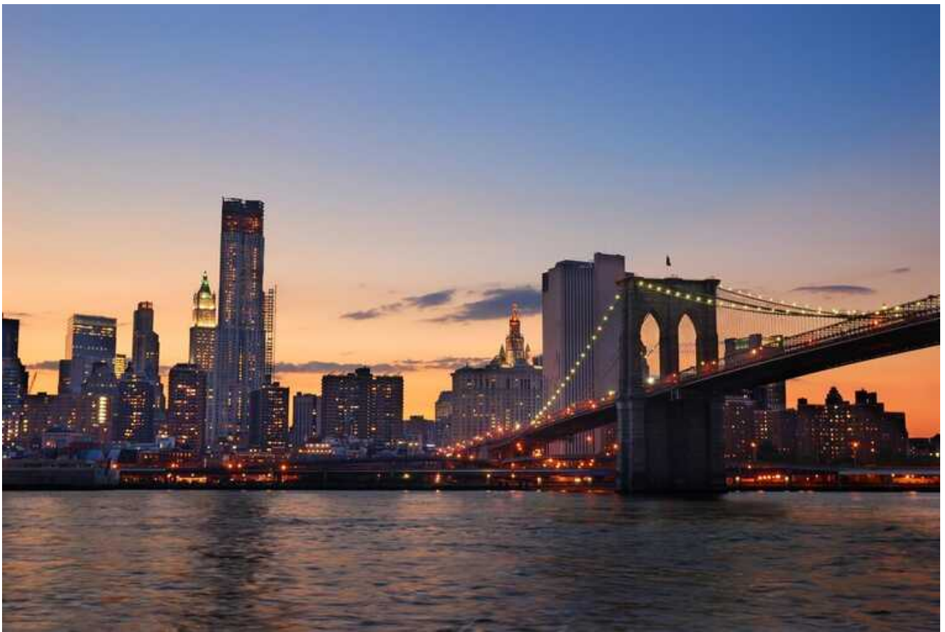
Земля під Нью-Йорком просідає стрімкими темпами: мільйони людей в небезпеці