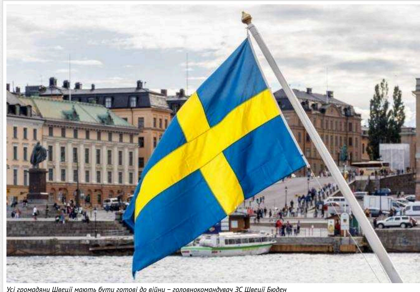
Усі громадяни Швеції мають бути готові до війни – головнокомандувач ЗС Швеції Бюдєн

Усі громадяни Швеції мають бути готовими до війни, переконані головнокомандувач Збройних сил країни Мікаель Бюдєн та міністр цивільної оборони Карл-Оскар Болін.