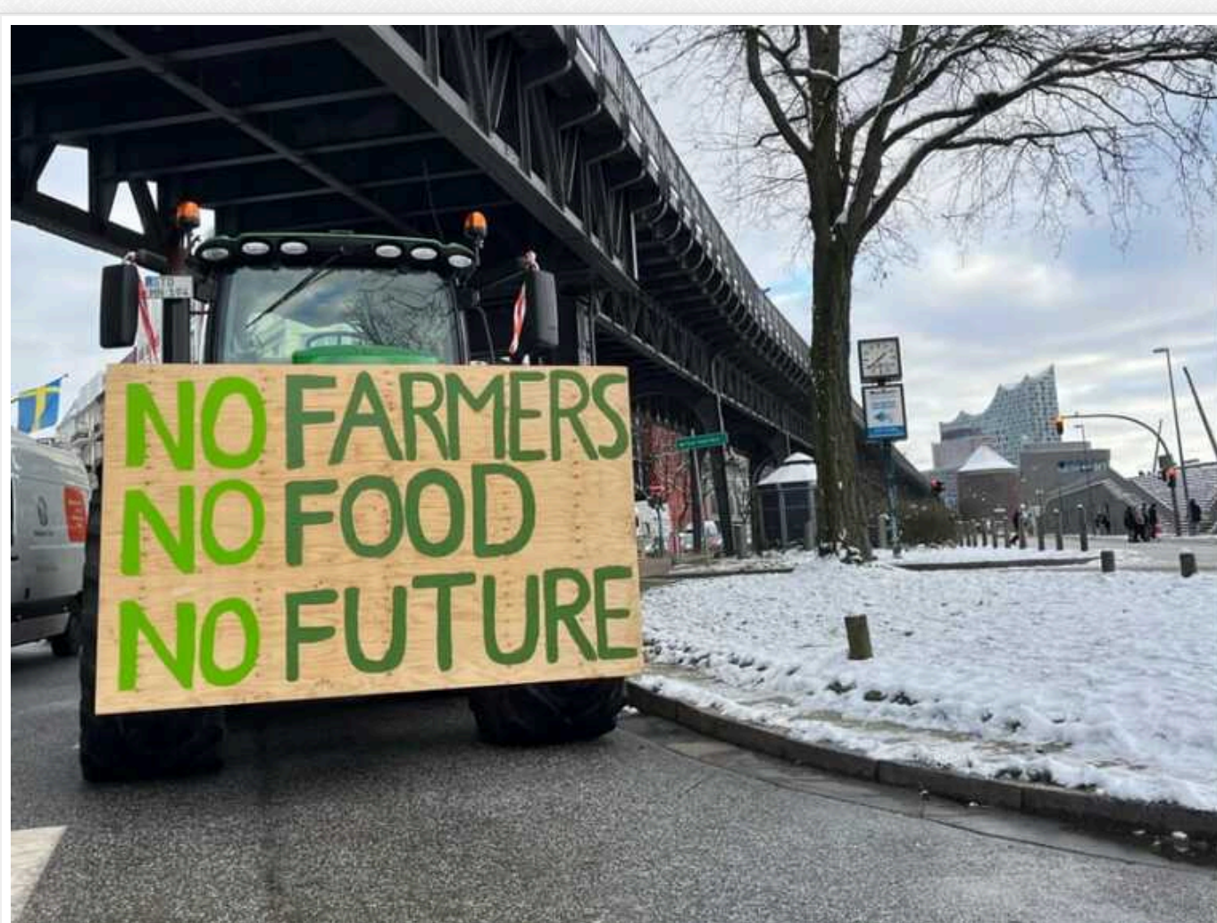
У Німеччині сьогодні розпочалася найбільша акція протесту фермерів: виступають проти скасування податкових пільг на дизель.

У Німеччині сьогодні розпочалася найбільша акція протесту фермерів, які виступають проти скасування податкових пільг та знижок на дизель.