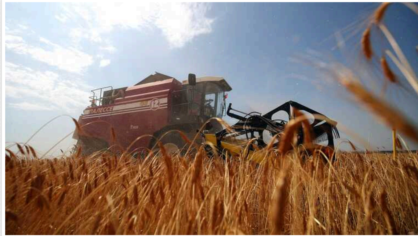
Польський єврокомісар висловив вимоги до всього Євросоюзу. Україні загрожує новий удар по експорту?

Єврокомісар від Польщі Януш Войцеховський, відповідальний у Єврокомісії (ЕК) за сільське господарство, погрожує зірвати продовження торгових преференцій ЄС для України. Серед іншого єврокомісар вимагає заборонити імпорту українського зерна, а також запровадити квоти на цукор та м'ясо птиці.