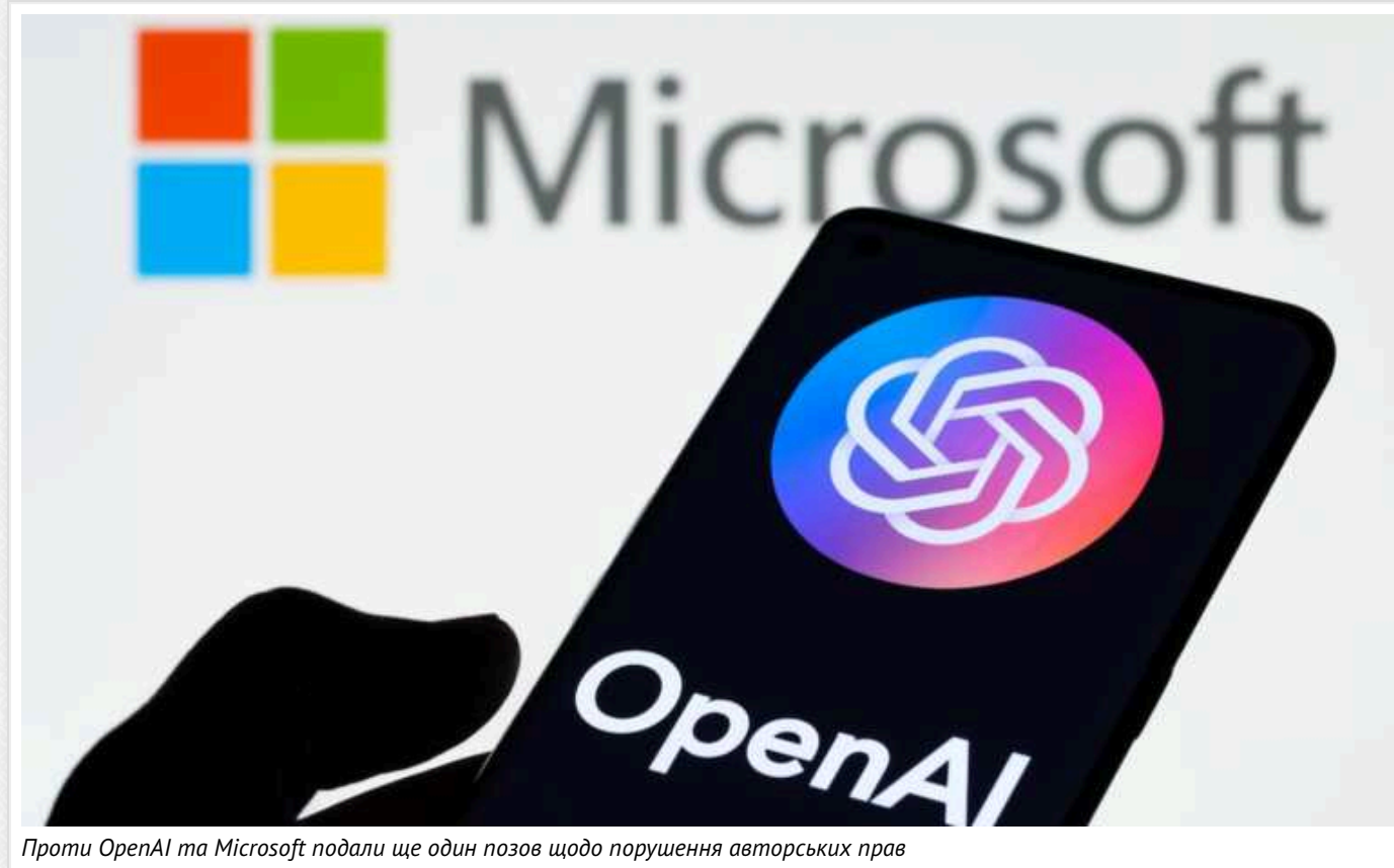
Проти OpenAI та Microsoft подали ще один позов щодо порушення авторських прав