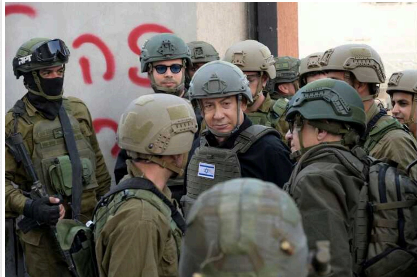
Ізраїль готовий вступити у війну з "Хезболлою" задля відновлення безпеки на півночі, – Нетаньягу

Ізраїль намагається уникнути війни ще й із ліванською "Хезболлою". Однак якщо вона буде неминучою, Ізраїль готовий до цієї війни.