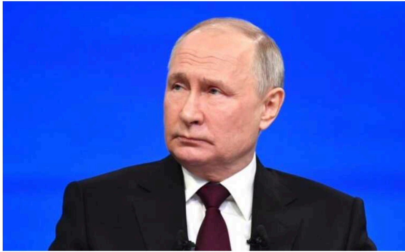
Путін створює умови, щоб Захід зрадив Україну на переговорах, — ISW

За словами аналітиків, нещодавні заяви повпреда РФ при ООН Дмитра Поляньського спрямовані на створення інформаційних умов, щоб переконати союзників зрадити Україну.