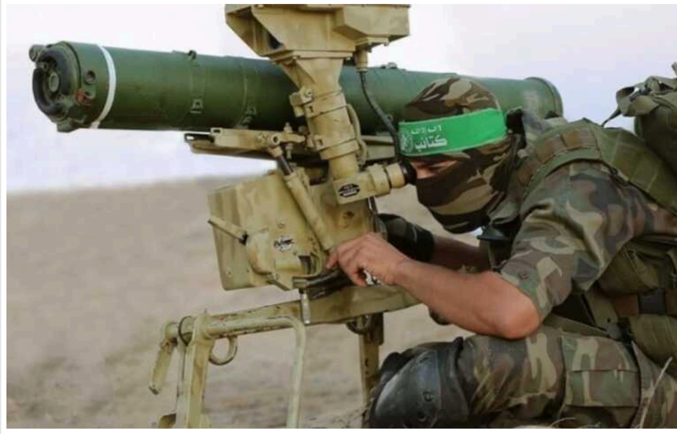
ХАМАС використовує проти Ізраїлю північно-корейську зброю, - розвідка Південної Кореї

За даними південнокорейської розвідки, ХАМАС отримав реактивний гранатомет F-7, вироблений у Північній Кореї. Пхеньян заперечує постачання зброї бойовикам.