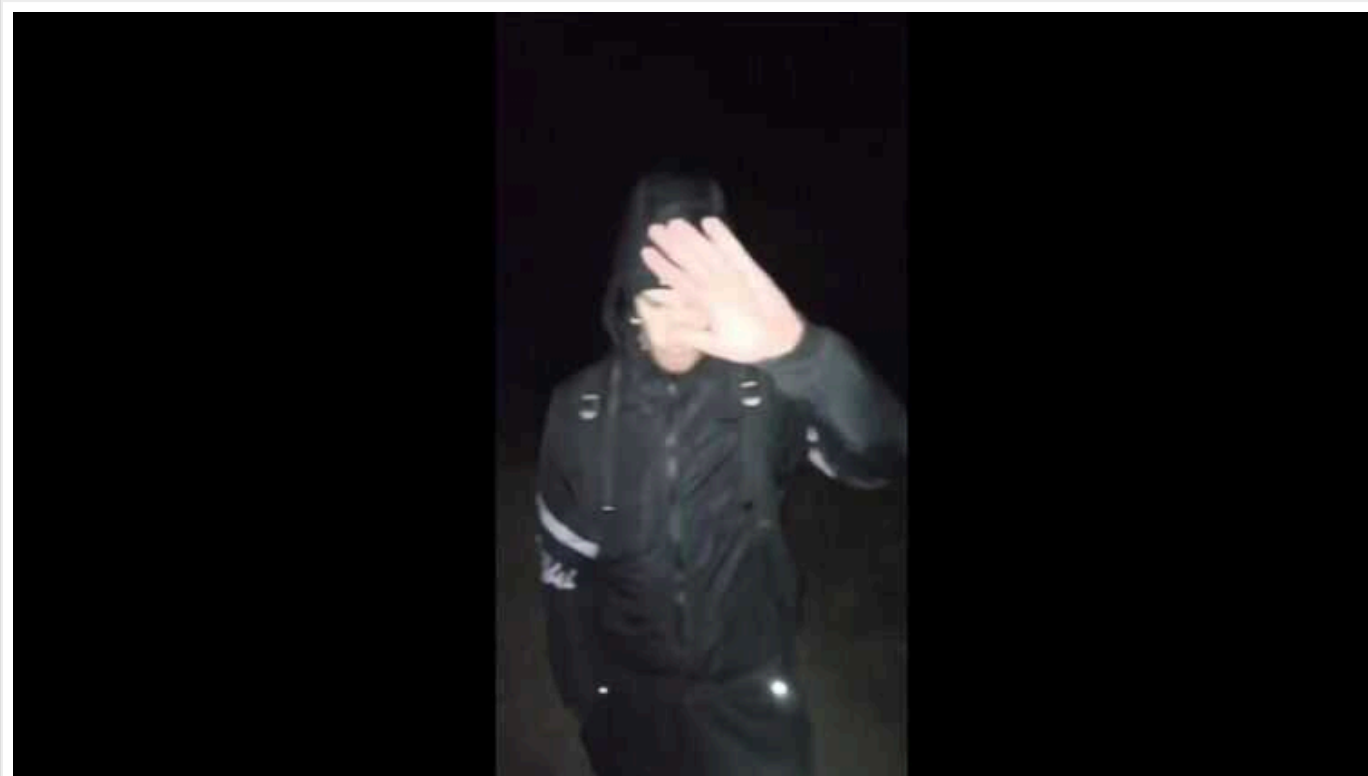
Українці за кордоном упіймали хлопця, який втік до Румунії

Хлопця, який розповідає у соцмережах, як переплив Тису та опинився у Румунії, знайшли в Європі українці.