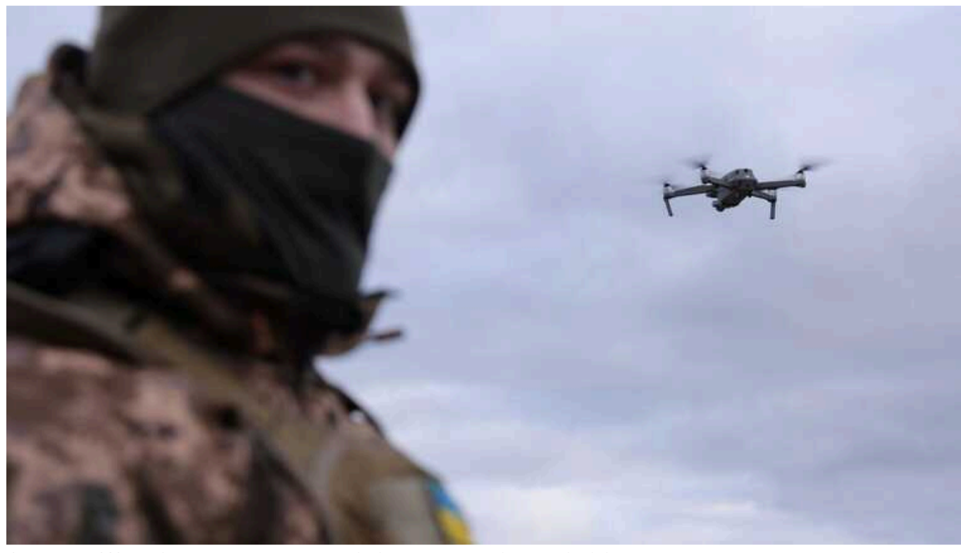
Оператори ССО ліквідували ворожу групу у складі 4 окупантів на підступах до Авдіївки

Оператори 8-го окремого полку ССО під час нічного спостереження зафіксували переміщення групи противника у складі чотирьох росіян на підступах до Авдіївки та ліквідували їх.