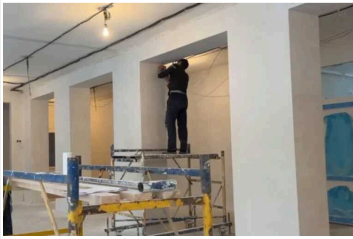
За гроші європейців планують нажитись на "відкатах" при відновленні ліцею у Балаклії

У Балаклії планують витратити 127 мільйонів гривень на ремонт ліцею № 4 за завищеними цінами. Є позиції, де ціна за одиницю завищена в сотні разів.