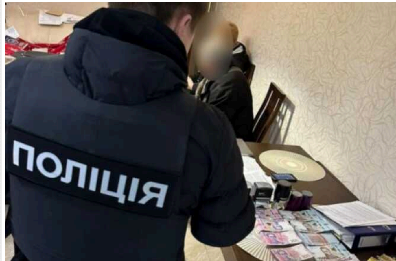
У Дніпропетровській області повідомили підозру членам ОЗУ: завдали збитків на 3,7 мільйона гривень на ремонті їдальні для військових

Серед учасників угруповання – посадові особи будівельної компанії та інженер з технічного нагляду.