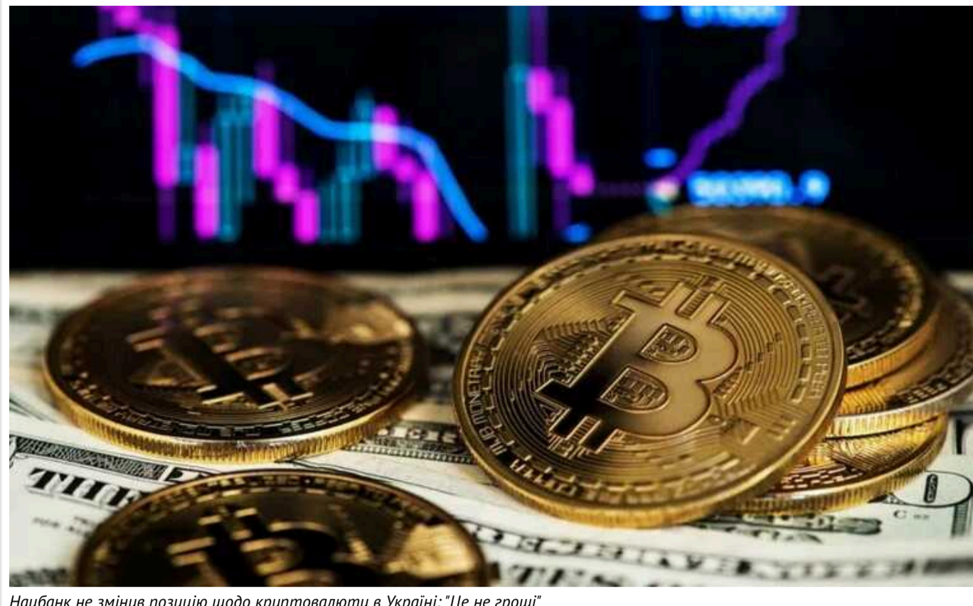
Нацбанк не змінив позицію щодо криптовалюти в Україні: "Це не гроші"

Остаточо допомогти вирішити питання про те, чи потрібна Україні легалізація криптовалютних операцій, має досвід інших країн у світі.