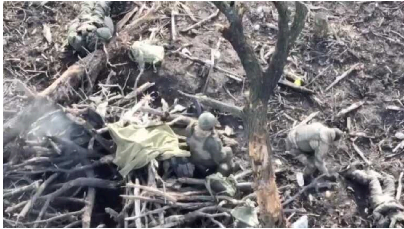
Окупанти облаштовують укриття під Авдіївкою з тіл загиблих товаришів по службі

Росіяни зазнають значних втрат на Авдіївському напрямі і вже почали облаштовувати укриття від українських ударних безпілотників.