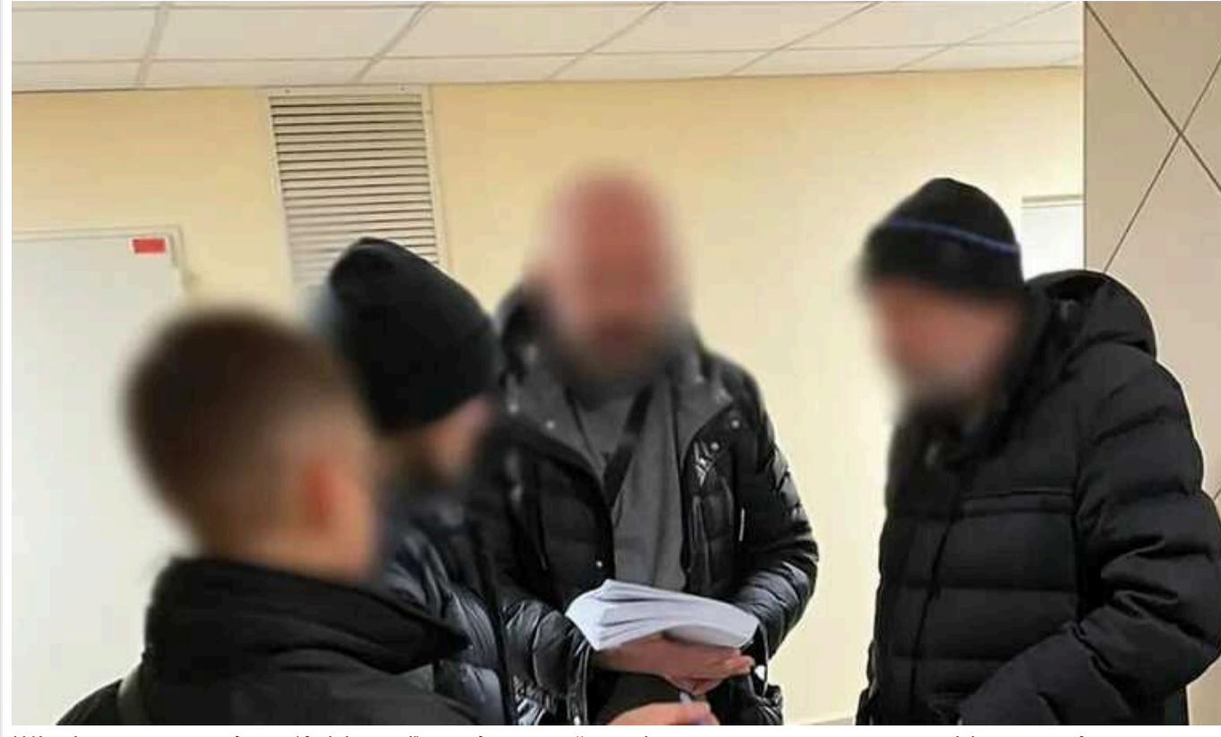
У Києві викрили експосадовця Адміністрації президента, який організував схему переправлення чоловіків через кордон

У Києві колишнього радника голови Адміністрації президента підозрюють у незаконному переправленні чоловіків призовного віку через кордон України. Вартість "послуг" становила 7 тисяч доларів США.