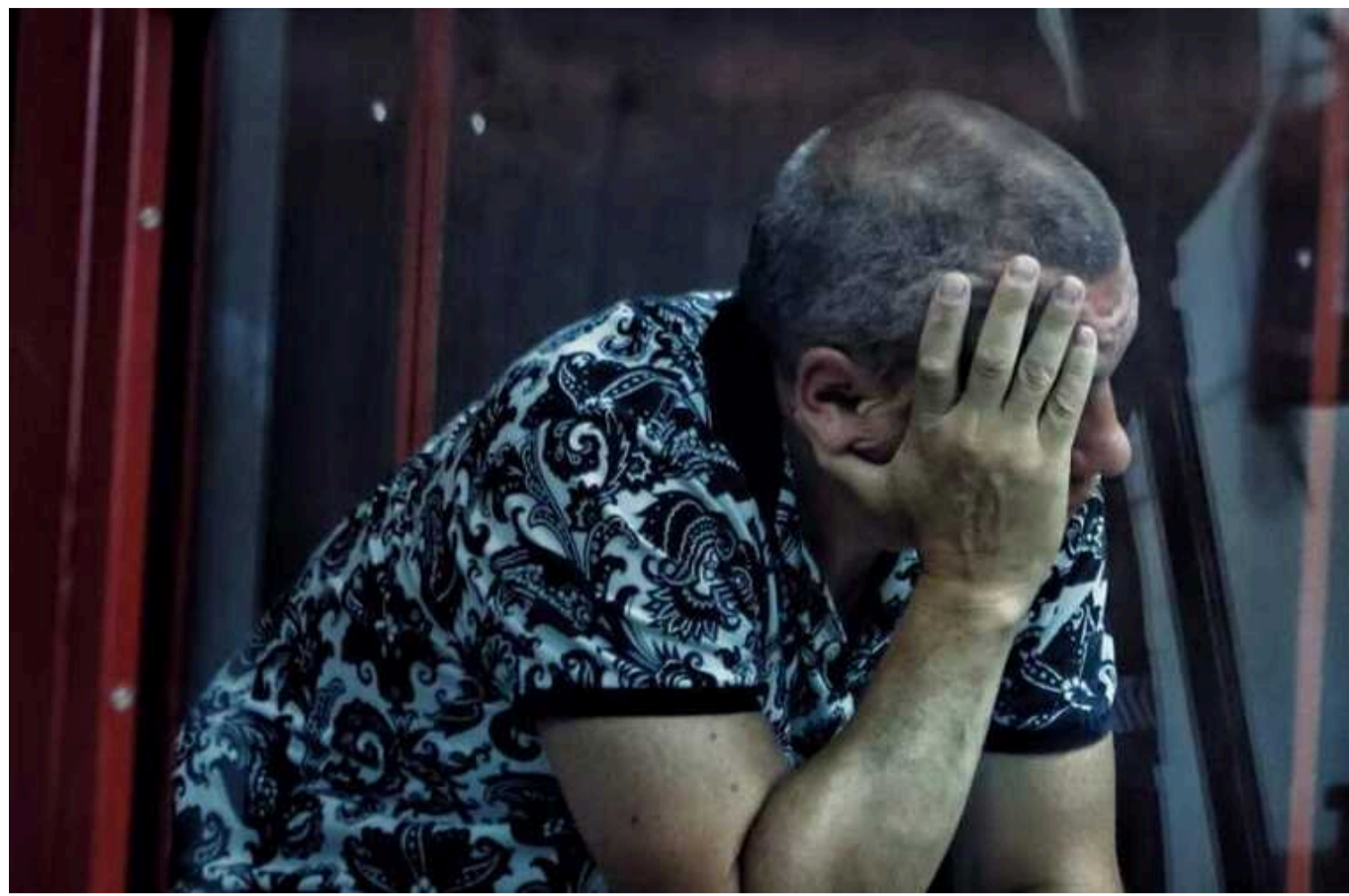
Справу про незаконне збагачення одеського ексвійськкома будуть розслідувати ще 3 місяці

Справу щодо ухилення від служби та незаконного збагачення колишнього військкома Одещини Євгена Борисова будуть розслідувати до 22 квітня цього року.