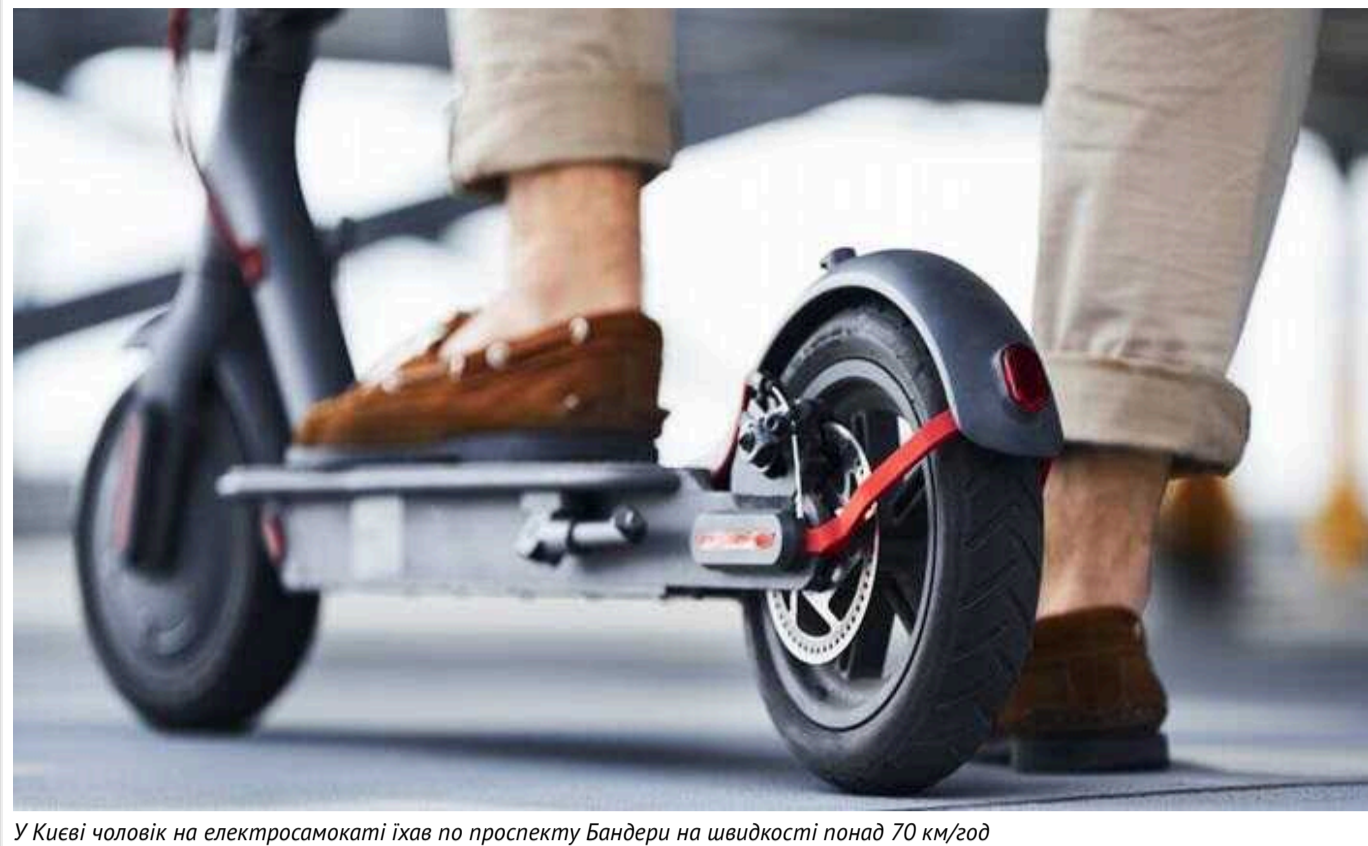
У Києві чоловік на електросамокаті їхав по проспекту Бандери на швидкості понад 70 км/год

У Києві на проспекті Степана Бандери помітили чоловіка, який їхав на електросамокаті зі швидкістю понад 70 кілометрів на годину. Місяцями він обганяв машини, які їхали в попутному напрямку.