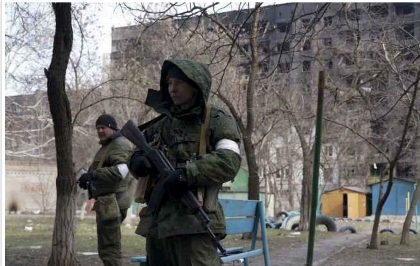
В окупованому Маріуполі на війну проти України вербують навіть у лікарнях

Російські загарбники продовжують вербувати на війну проти України жителів окупованих територій нашої держави. У Маріуполі "мілітаризували" навіть лікарні.