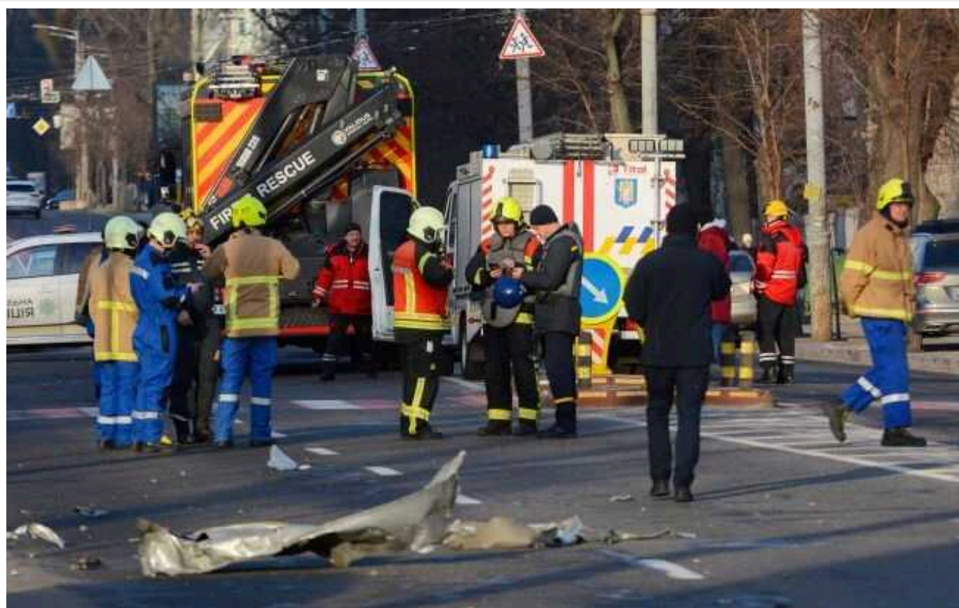
Ракетна атака по Україні: вже 34 особи поранено, 4 загинули

Через ракетний удар по Україні 8 січня 34 особи поранено, ще 4 загинули.