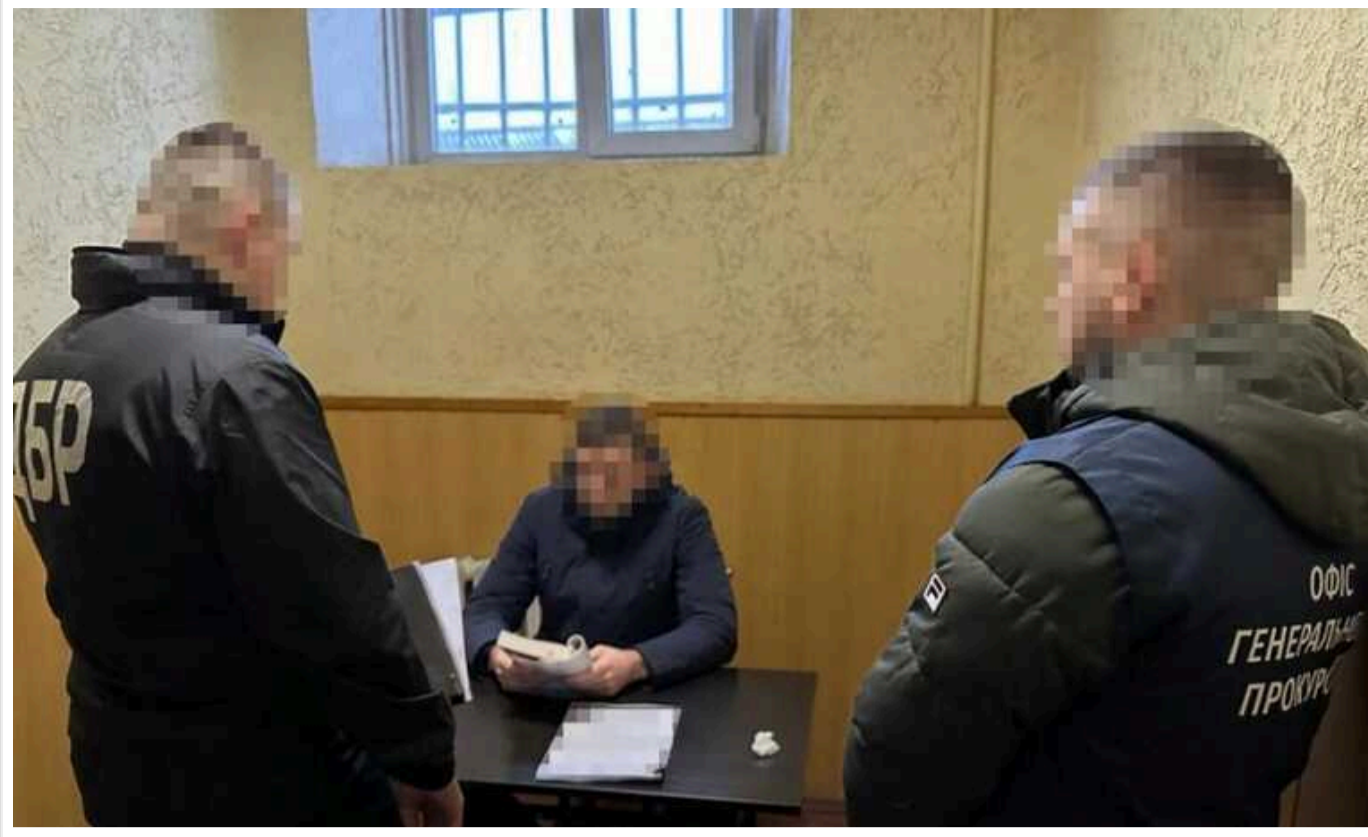
Експосадовцям Міноборони повідомили про нову підозру: розтрата майже 950 мільйонів гривень держкоштів

Працівники Державного бюро розслідувань, спільно з СБУ, повідомили про нову підозру колишньому заступнику міністра оборони України та ще двом експосадовцям відомства у розтраті майже 950 млн гривень державних коштів на закупівлі бронезилетів для армії.