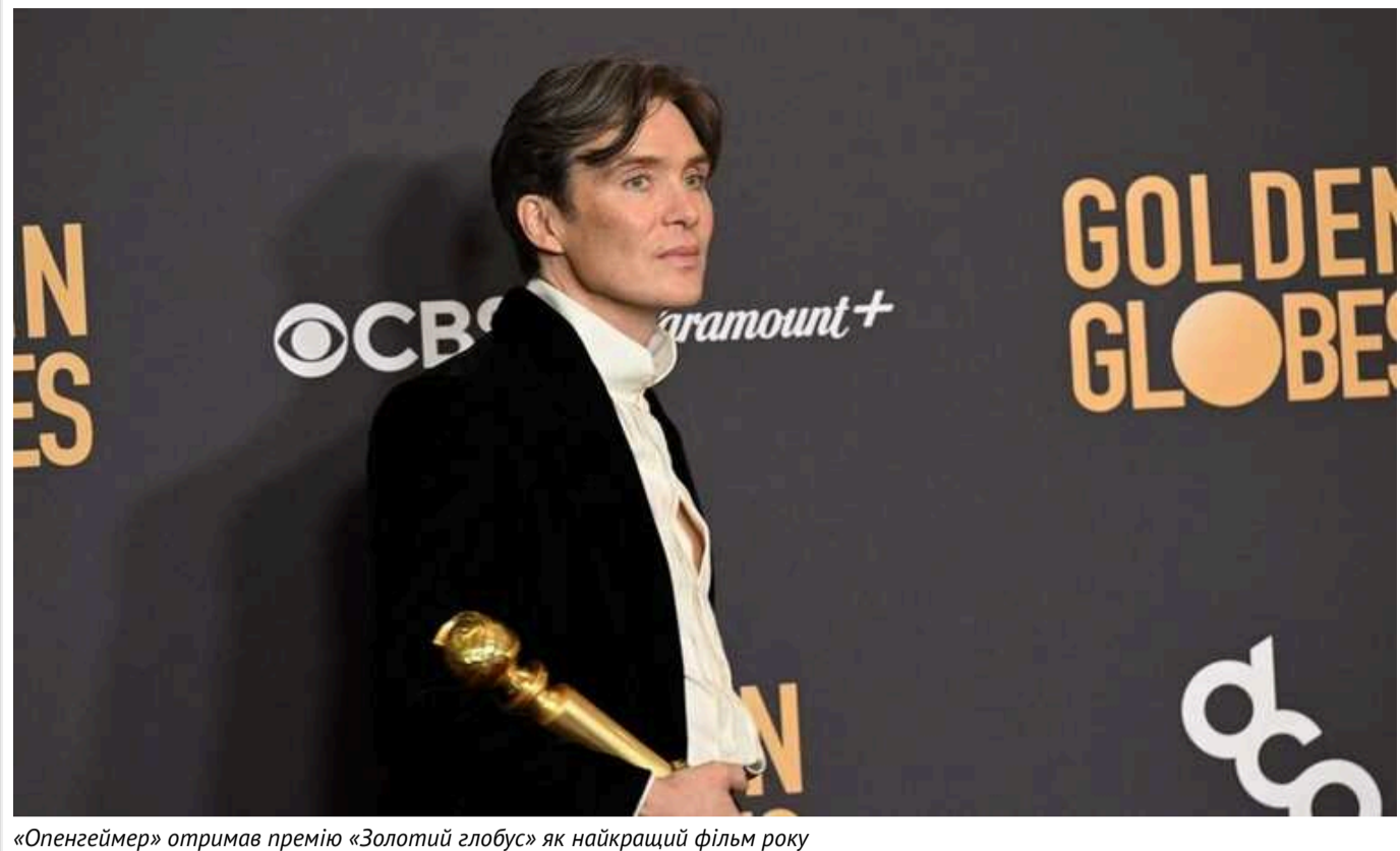
«Опенгеймер» отримав премію «Золотий глобус» як найкращий фільм року

Фільм «Опенгеймер» отримав одразу чотири «Золоті глобуси»: за режисуру (Крістофер Нолан), чоловічу драматичну роль (Кілліан Мерфі), музику (композитор Людвіг Йоранссон) та чоловічу роль другого плану (Роберт Дауні-молодший). Мюзиклом року стала картина «Бідні-нещасні».