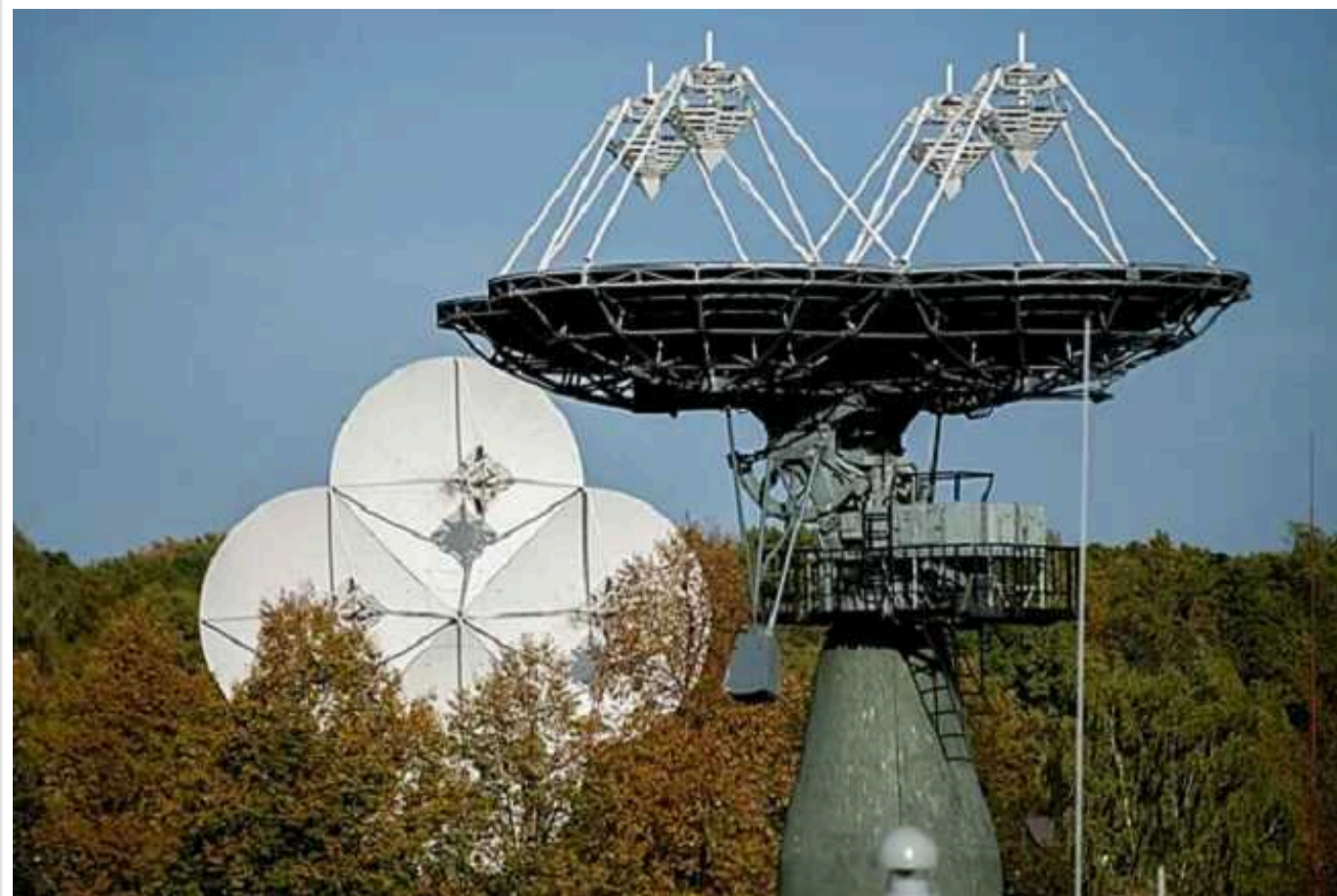
Армія РФ зберігає перевагу в системах РЕБ, - Financial Times

РФ зберігає вагомую перевагу перед Україною за системами радіоелектронної боротьби (РЕБ), оскільки вже понад десять років інвестує значні кошти в цю сферу.