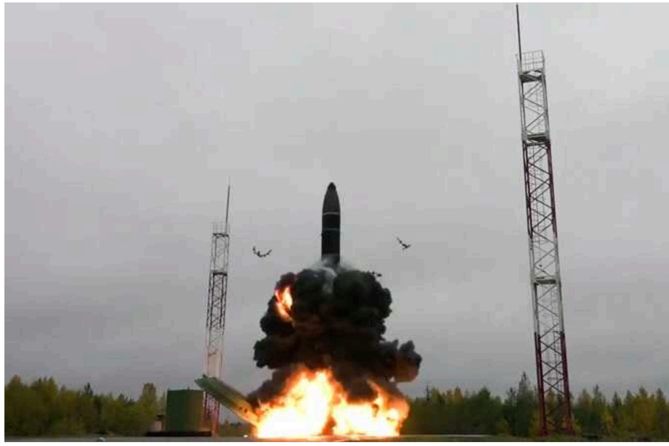
Росія відкрито загрожує світу запуском міжконтинентальної балістики

За останні 5 років росіяни запустили понад 20 таких ракет, ідеться у ворожому відомстві.