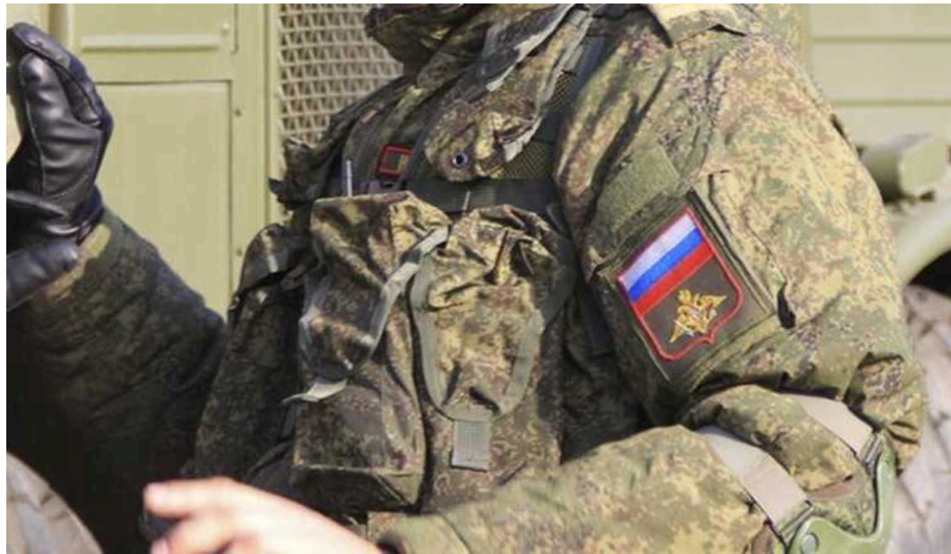
Окупант повернувся у мирне життя і в шоці від того, що побачив у Росії

Каже, росіяни масово не співічувують співвітчизникам-вбивцям, ніхто не хоче думати про те, що вони проходять на фронті. На Новий рік у РФ ніхто і не думав влаштовувати жалобу - росіяни гуляють на повну катушку, поки їхні співгромадяни гинуть у штурмах Авдіївки та Мар'їнки. Він побачив, як росіяни запускають салюти, поки його товариші по службі на війні мруть сотнями за хвилину.