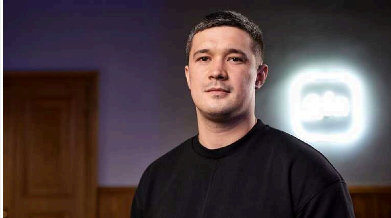
Україна планує збільшити виробництво захисту від ворожих безпілотників

Україна планує збільшити виробництво захисту від ворожих безпілотників Зокрема, засобів радіоелектронної боротьби та наземних безпілотних платформ.