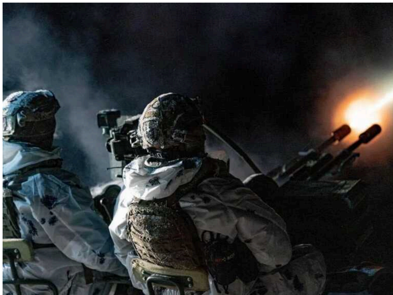
На Одещині пролунали вибухи: працює ППО

На Одещині пролунали вибухи сьогодні ввечері, 7 січня. Працюють сили протиповітряної оборони.