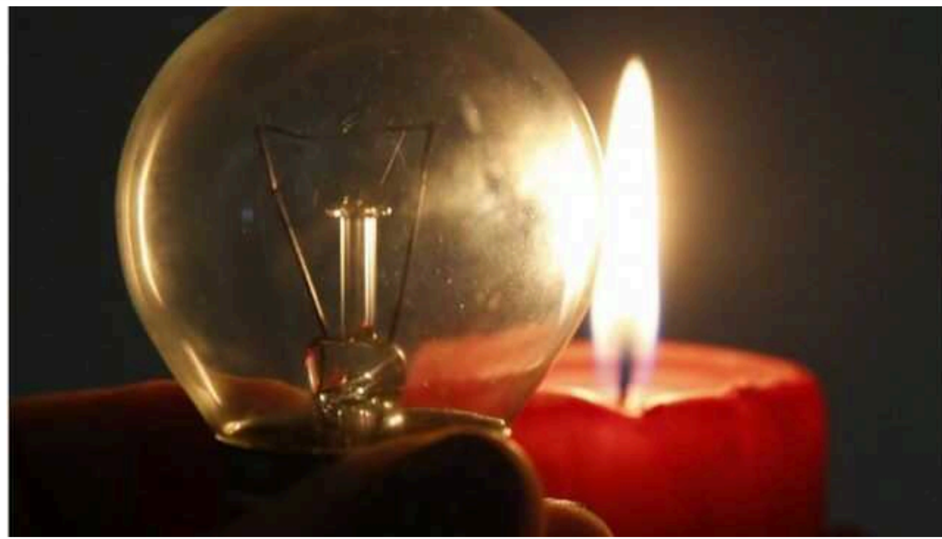
Через негодую в Україні закликали економити електроенергію

Українівців закликали економити електроенергію в піковий годинник. Зокрема, через негодую, що насувається на Україну.