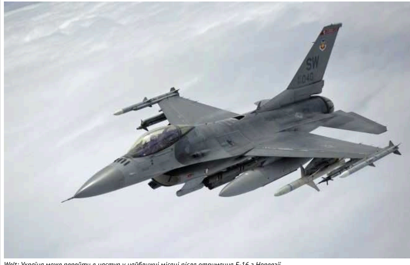
Welt: Україна може перейти в наступ у найближчі місяці після отримання F-16 з Норвегії

З отриманням літаків F-16 від Норвегії в найближчі місяці Україна може перейти в наступ, — німецьке видання Welt.