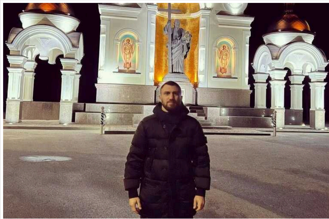
Ломаченко російською привітав усіх з Різдвом, нарвавшись на коментарі у відповідь

Читати на русском Додати як бажане джерело в Google