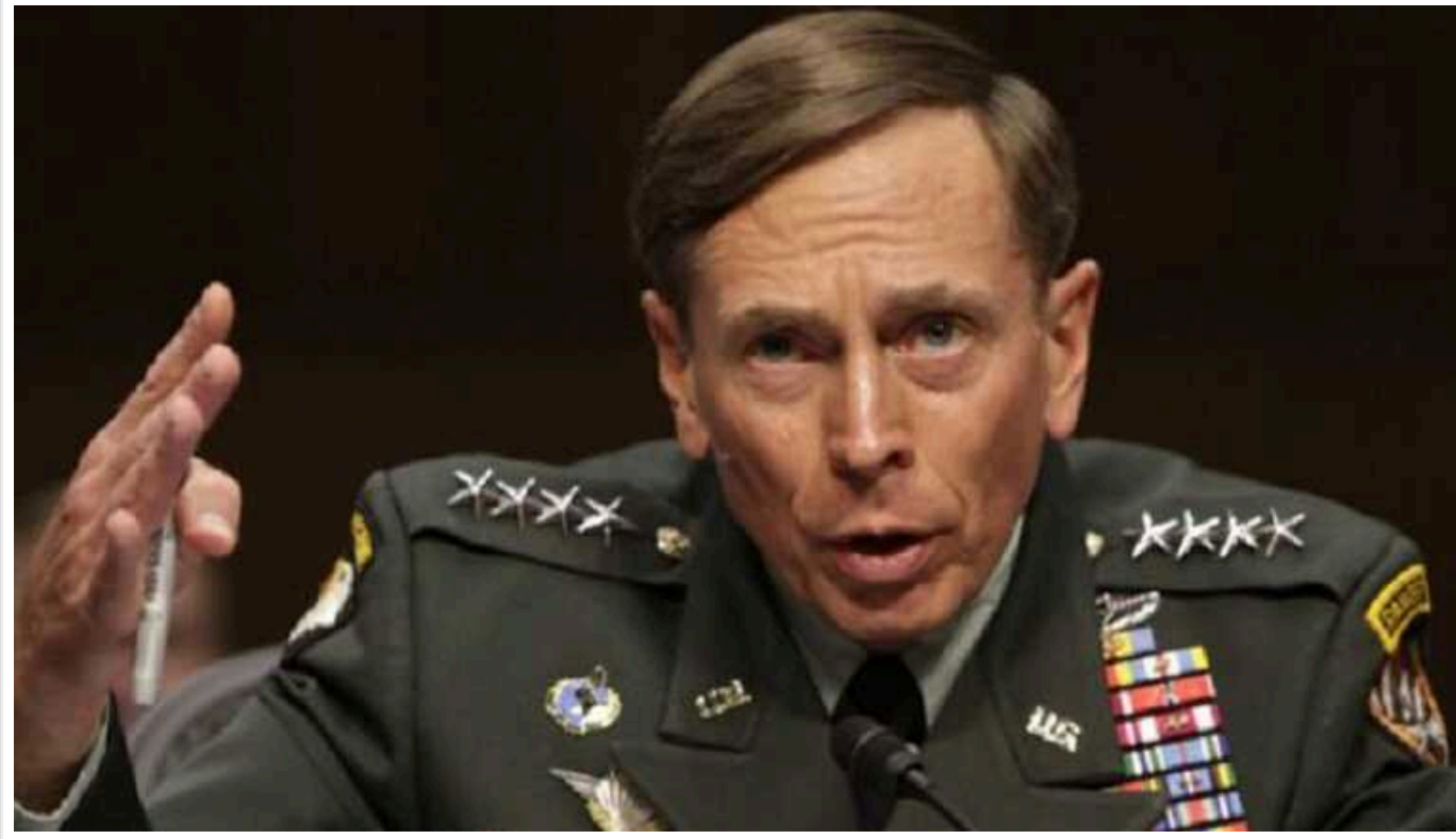
Якщо Путін переможе в Україні, наступною стане Молдова або одна з країн Балтії, - ексдиректор ЦРУ Петреус

У разі поразки України у війні держава-терорист Росія не зупиниться на досягнутому. Її наступними цілями може стати Молдова або одна з країн Балтії.