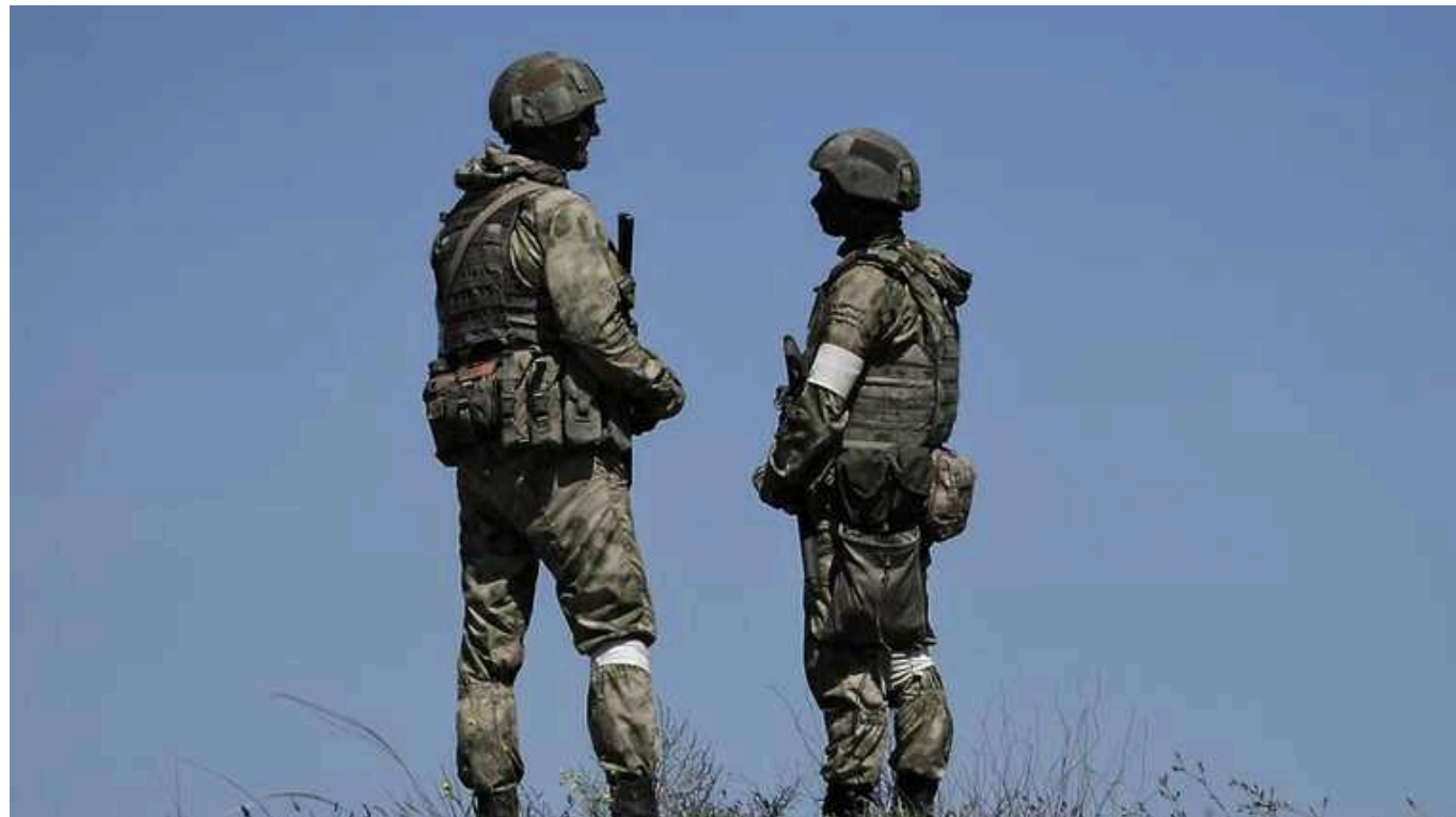
РФ перекинула на окуповані території десятки тисяч росгвардійців – ЦНС

Держава-терорист Росія зосередила на тимчасово окупованих територіях України десятки тисяч співробітників росгвардії. Станом на січень 2024 року РФ перекинула в Україну близько 35 тис. росгвардійців.