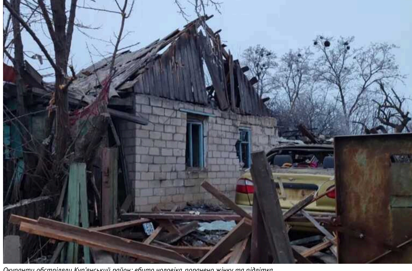
Окупанти обстріляли Куп'янський район: вбито чоловіка, поранено жінку та підлітка

Війська РФ 7 сіння завдали ударів по низці населених пунктів Куп'янського району, що на Харківщині. У селі Нечволодівка загарбники вбили чоловіка та поранили жінку.