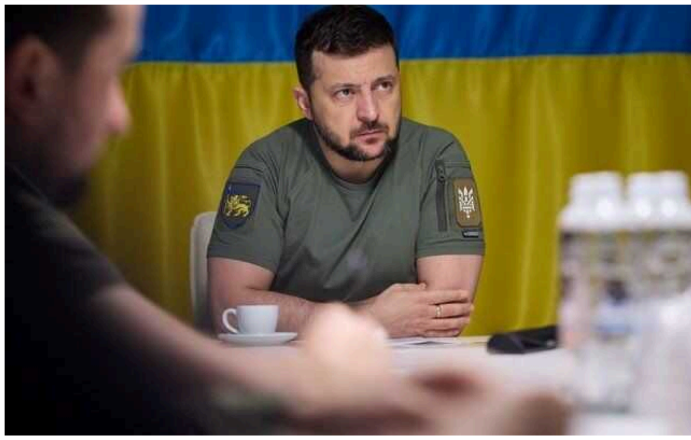
Зеленський провів велику нараду щодо відносин із НАТО та ЄС

Президент Володимир Зеленський провів тривалу нараду щодо планів України на поточний рік у відносинах з партнерами в Євросоюзі та в НАТО. Пріоритетом: реалізація рішення про відкриття перемовин, підготовка переговорної рамки з Євросоюзом, формування такої системи відносин і комунікації з членами Альянсу, щоб кожен відчував, що разом з Україною НАТО стане значно сильнішим.