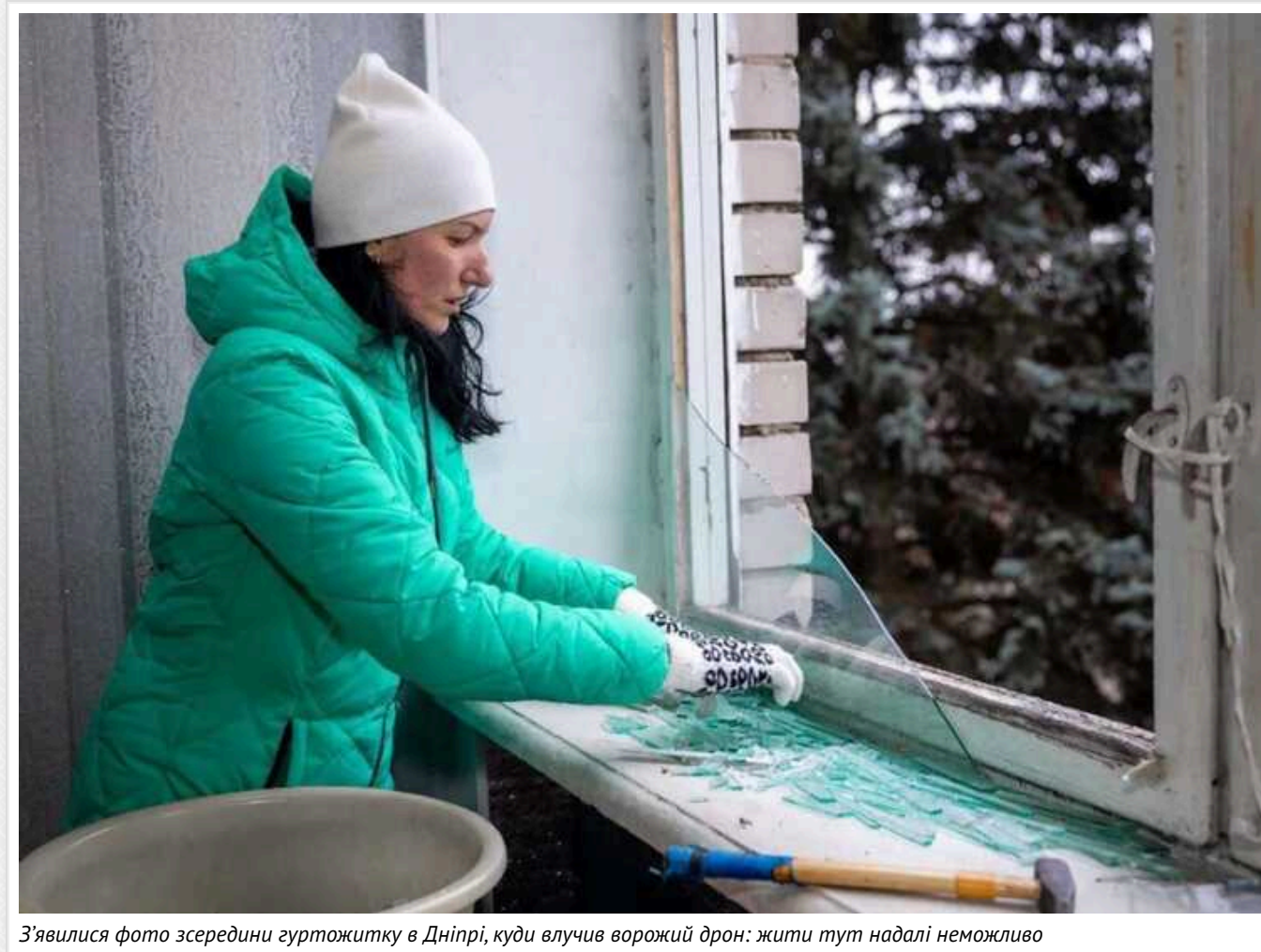
З'явилися фото зсередины гуртожитку в Дніпрі, куди влучив ворожий дрон: жити тут надалі неможливо

У Дніпрі від нальоту «Шахедів» у ніч на 7 січня найбільше постраждав гуртожиток, де мешкають понад два десятки родин. У будівлі немає жодної цілісної шибки, підлога асіана битим склом, меблі потрачені. Люди мішками виносять уламки та лагодять, що можуть.