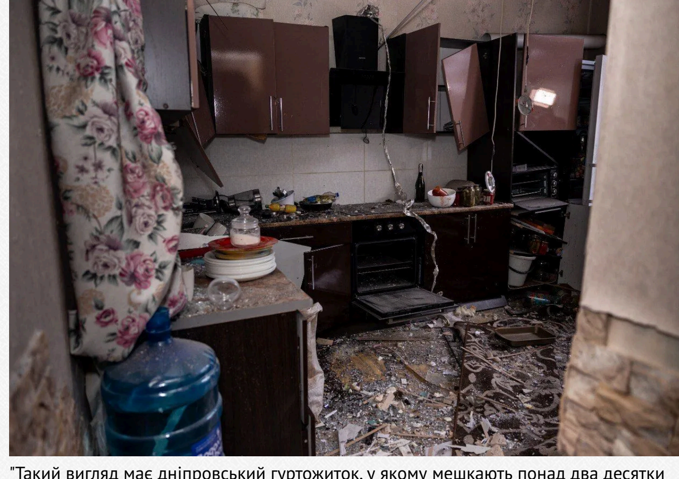
Фото наслідків удару по гуртожитку опублікував керівник Дніпропетровської ОВА Сергій Лисак. За його словами, через вибиті шибки по коридорах і квартирах будівлі гуляє холодний вітер.

Такий вигляд має дніпровський гуртожиток, у якому мешкають понад два десятки родин. Йому дісталось найбільше під час вчорашньої вечірньої атаки «Шахедами», — розповів керівник області.