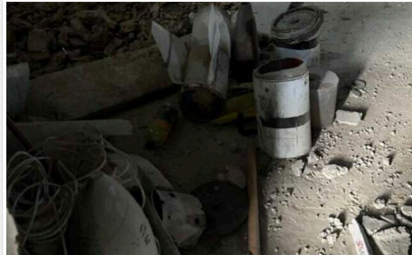
ХАМАС розробив керовані крилаті ракети під керівництвом Ірану: ЦАХАЛ виявила компоненти, яких це угруповання не мало

Ізраїльські війська, що діють у місті Газа, виявили технологічне обладнання, включаючи компоненти, що використовуються ХАМАСом для створення точних ракет, яких, як вважалося досі, це терористичне угруповання не мало.