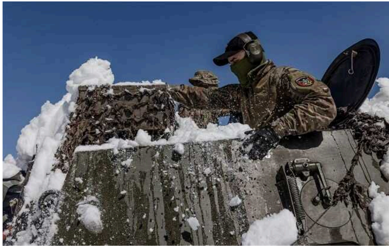
Ситуація на фронті: протягом доби відбулося 29 бойових зіткнень

Російські загарбники здійснили два безуспішні штурми на плацдарми українських захисників на лівобережжі Дніпра.