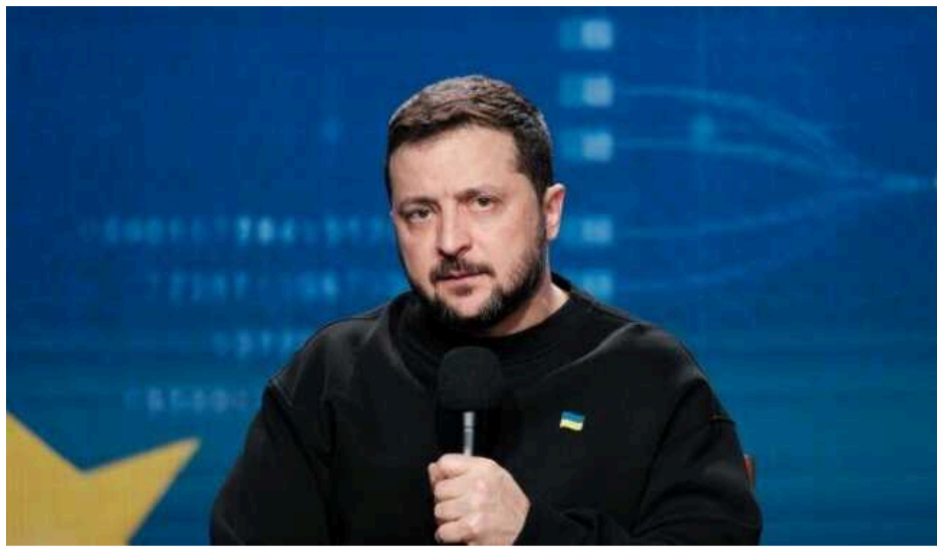
Зеленський зустрівся із главою МЗС Японії

Президент України Володимир Зеленський зустрівся із міністром закордонних справ Японії Йоко Камікавою.