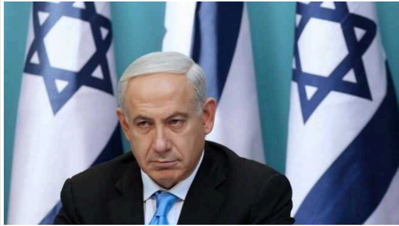
Нетаньягу заявив про готовність врегулювати конфлікт із "Хезболлою" політичними способами